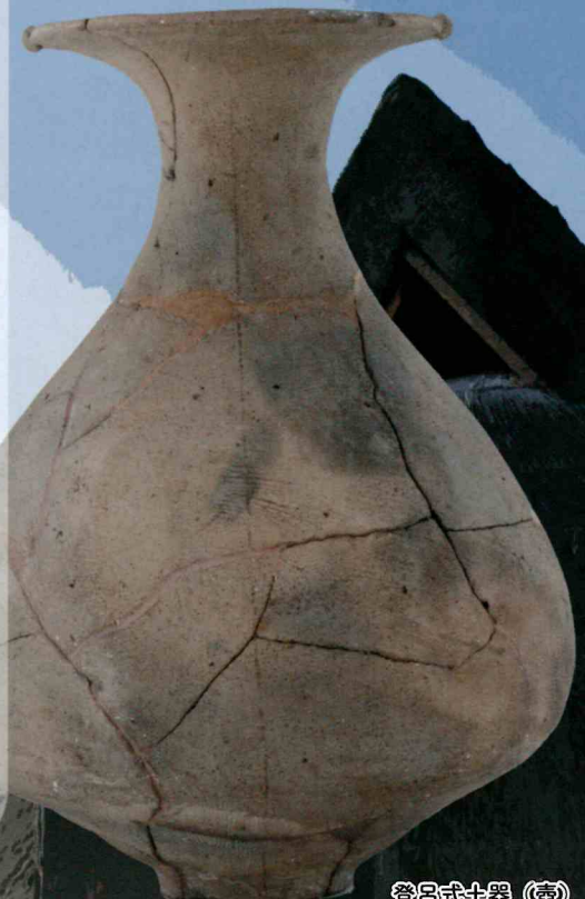
登呂式土器 (壺) (登呂博物館蔵)

『西の登呂』——大分県国東市にある国史跡「安国寺集落遺跡」で、登呂遺跡発掘の2年後に発掘調査が行われた際、登呂遺跡と多くの共通点があることから地元新聞社に称されました。本展覧会では、『西の登呂』——こと国史跡安国寺集落遺跡の出土品が初めて静岡・登呂博物館に到来します。 2つの遺跡の出土品を通じて、弥生時代後期に沖積地で展開した稲作農耕集落の特徴や相違点を探るとともに、両遺跡の発掘にまつわる歴史や、史跡の整備・活用についても紹介します。