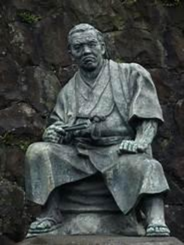
【梅蔭禅寺：次郎長翁銅像】