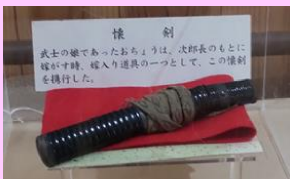
【おちょうさんの懐剣】